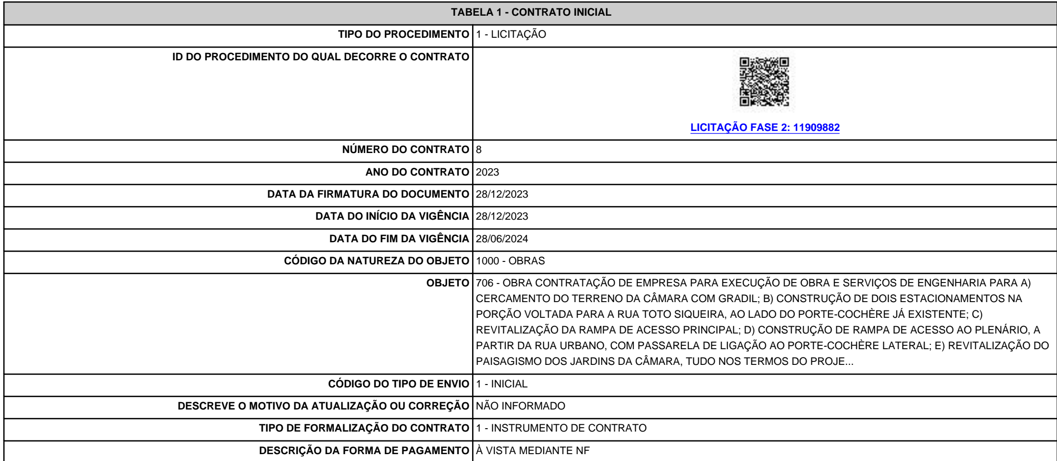
TABELA 1 - CONTRATO INICIAL

PRESTAÇÃO DE CONTAS LICITAÇÕES, DISPENSAS E ADESÃO A REGISTRO DE PREÇOS LAYOUT CONTRATO INICIAL DATA DA ENTREGA 28/12/2023 RECIBO 017e2fe4-9a8b-4a5a-97c0-55094038fbaa